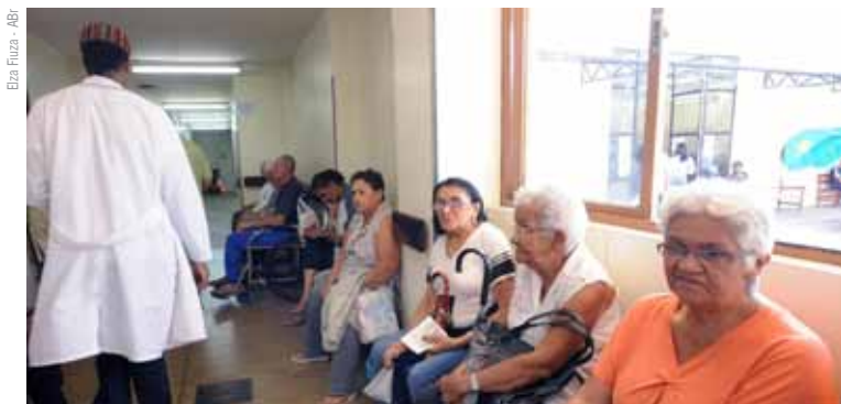
Pacientes do SUS aguardam atendimento médico em hospital do DF

A proposta da Contribuição Social da Saúde, além de ser exclusiva para a saúde, previa uma faixa de isenção de R$ 3,5 mil, o que excluiria a maioria dos brasileiros da cobrança. Além de distribuir renda, facilitaria o combate à sonegação e à lavagem de dinheiro. Um correntista que movimentasse R$ 5 mil por mês, por exemplo, pagaria apenas R$ 4,50 –o equivalente à alíquota de 0,3% sobre os R$ 1.500 que excedessem a faixa de isenção. Ninguém ficaria pobre por isso, e o SUS ganharia cerca de R$ 12 bilhões por ano.