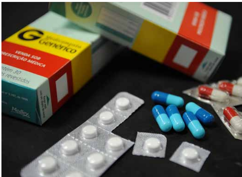
Por impedir a produção de genéricos, as patentes tornam os preços dos medicamentos mais caros

Tramita desde 2009 no STF uma ação de inconstitucionalidade movida pela Procuradoria Geral da República contra esse tipo de patente, por permitir o monopólio de produtos e medicamentos que já seriam de domínio público. A falta de concorrência eleva o preço dos remédios.