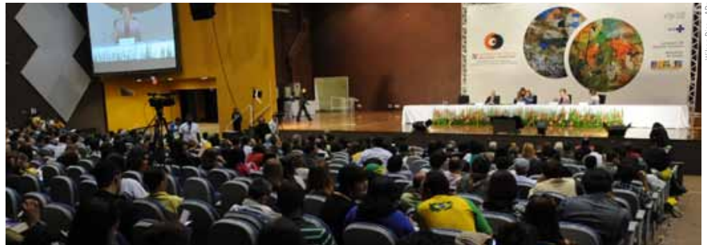
Plenário da 4ª Conferência Nacional de Saúde Mental, realizada em junho de 2010

Há registros de desrespeito à orientação sexual nesses locais, entre outras denúncias. Relatório divulgado no fim de novembro pela Comissão Nacional de Direitos Humanos do Conselho Federal de Psicologia pede que o Ministério Público investigue denúncias de maus tratos e que o Ministério do Trabalho fiscalize a ocorrência de trabalho forçado. A comissão vistoriou 68 instituições de internação para usuários de drogas, em 24 Estados e no Distrito Federal.