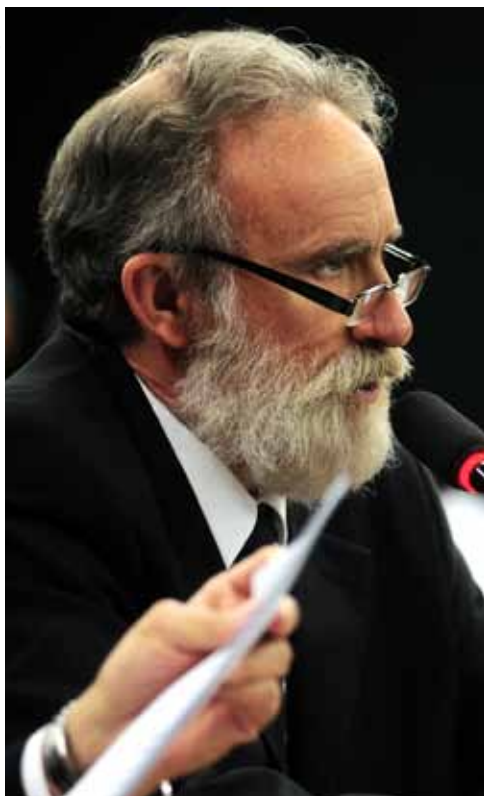
Dr. Rosinha, em comissão da Câmara dos Deputados

A edição 2011 do Prêmio Congresso em Foco colocou Dr. Rosinha em nono lugar na lista dos melhores deputados federais do país. Em outra categoria, a de parlamentar que mais se destaca na defesa da saúde, Rosinha ficou em segundo lugar, atrás apenas do senador Paulo Paim (PT-RS), o que faz do paranaense o deputado de maior relevância na área.