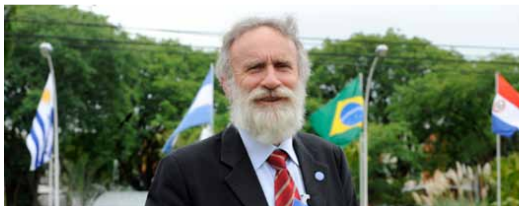
O parlamentar petista, em Foz do Iguaçu, durante a 40ª Cúpula do Mercosul (16.dez.2010)

A bancada brasileira no Parlasul terá 74 deputados, eleitos através de listas partidárias. Essas listas deverão ter alternância entre homens e mulheres. Os cinco primeiros nomes também devem conter candidatos de cada uma das cinco regiões do país. O mesmo vale para o grupo do sexto ao décimo nome.