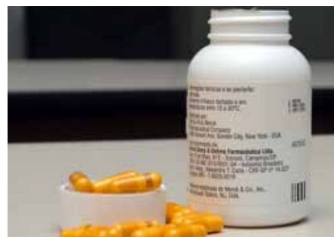
Remédio anti-aids Efavirenz (Merck), cuja patente o Brasil quebrou em maio de 2007

O acordo afetaria a qualidade do exame no Brasil e a autonomia dos examinadores brasileiros, além de favorecer empresas americanas.