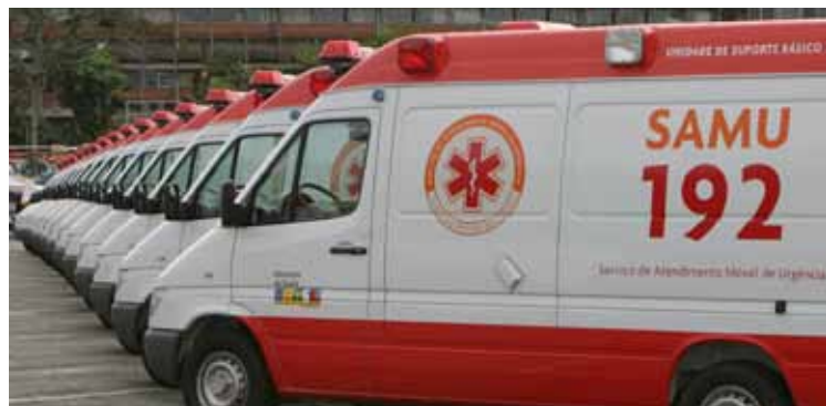
Novas ambulâncias do Serviço de Atendimento Móvel de Urgência (Samu)